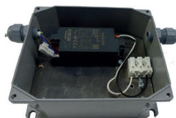
Figur 2: Inside av armatur