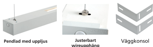
Pendlad med uppljus

Kan förses med dragströmbrytare. Livslängd L80 Ta25 60000h (B50) MacAdam 3 SDCM CRI: >80 | CE Energiklass (LED modul): C, D